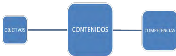
Fig. 1. Relación entre objetivos, contenidos y competencias

6. El análisis de la coherencia entre objetivos, competencias y contenidos. También estos tres elementos tienen que ser coherentes, como es lógico, con las actividades y los recursos didácticos que se preparen para utilizar en el curso: Por ejemplo, en el curso de Redacción para la Comunicación, para conseguir los objetivos planteados y avanzar hacia la consecución de las competencias señaladas se desarrollan unos contenidos que son coherentes. Para entenderlo mejor podemos plantearlo gráficamente: