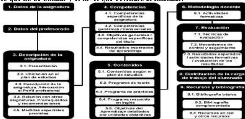
Figura 1 Esquema de la Guía Docente Adaptada al EEES

Para los estudiantes la Guía Docente, sirve para visualizar el trabajo y proceso de enseñanza-aprendizaje que cursará en determinada asignatura, de tal manera que pueda tener todo el panorama del curso y así logre planificar su tiempo de dedicación, los recursos que ha de utilizar y el nivel que obtendrá al finalizar.